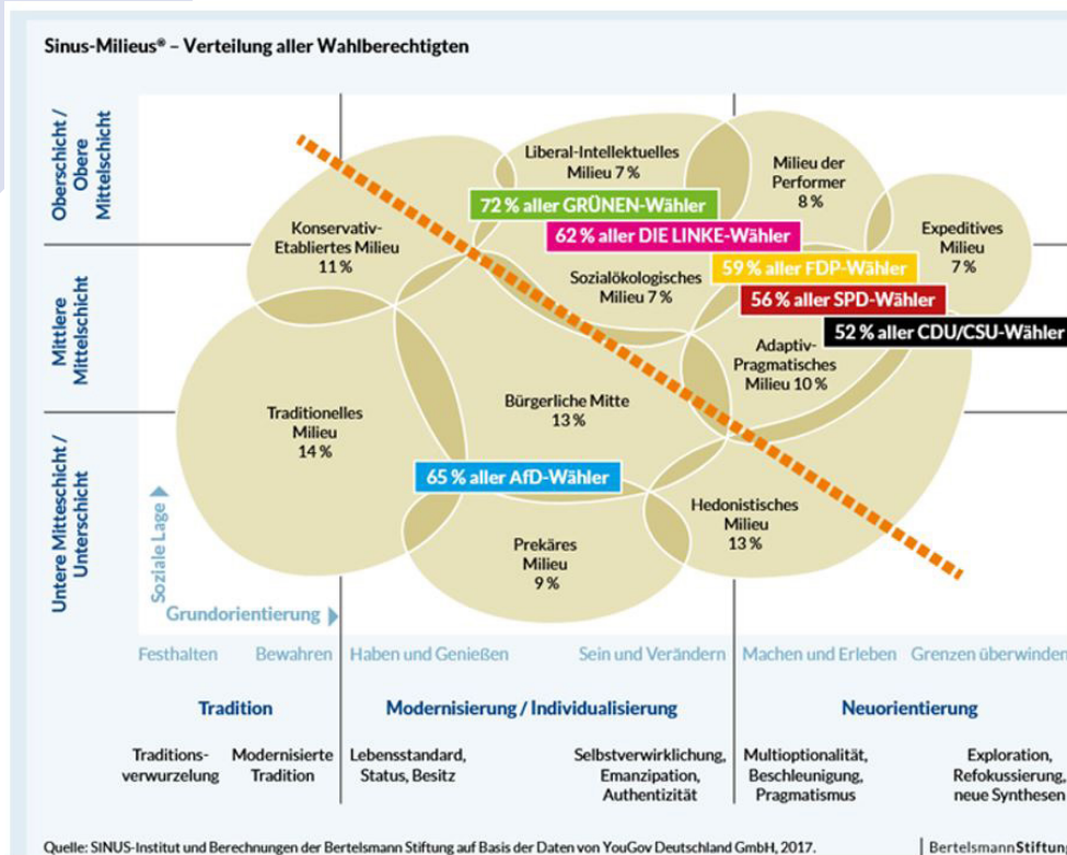
Abbildung 1: Sinus-Milieus® - Verteilung aller Wahlberechtigten 40

führung [...]“ 38 bezeichnet. Die untenstehende Abbildung 1 zeigt die genaue Verteilung und illustriert zugleich, warum Vorgängermodelle dieser als „Kartoffelgrafik“ 39 bezeichnet wurden.